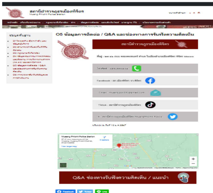
ภาพแสดงช่องทางการร้องเรียนทาง Website ของสถานีตำรวจ

เมื่อวันที่ ๗ มี.ค.๖๗ พ.ต.อ.อนุพันธ์ สุสม ผกก.สภ.เมืองพิจิตร พร้อมด้วยคณะกรรมการพิจารณาเลื่อนขั้นเลื่อนเงินเดือน ของ สภ.เมืองพิจิตร ร่วมกันพิจารณาการเลื่อนขั้นเลื่อนเงินเดือนของข้าราชการตำรวจ สภ.เมืองพิจิตร ครั้งที่ ๑/๖๗